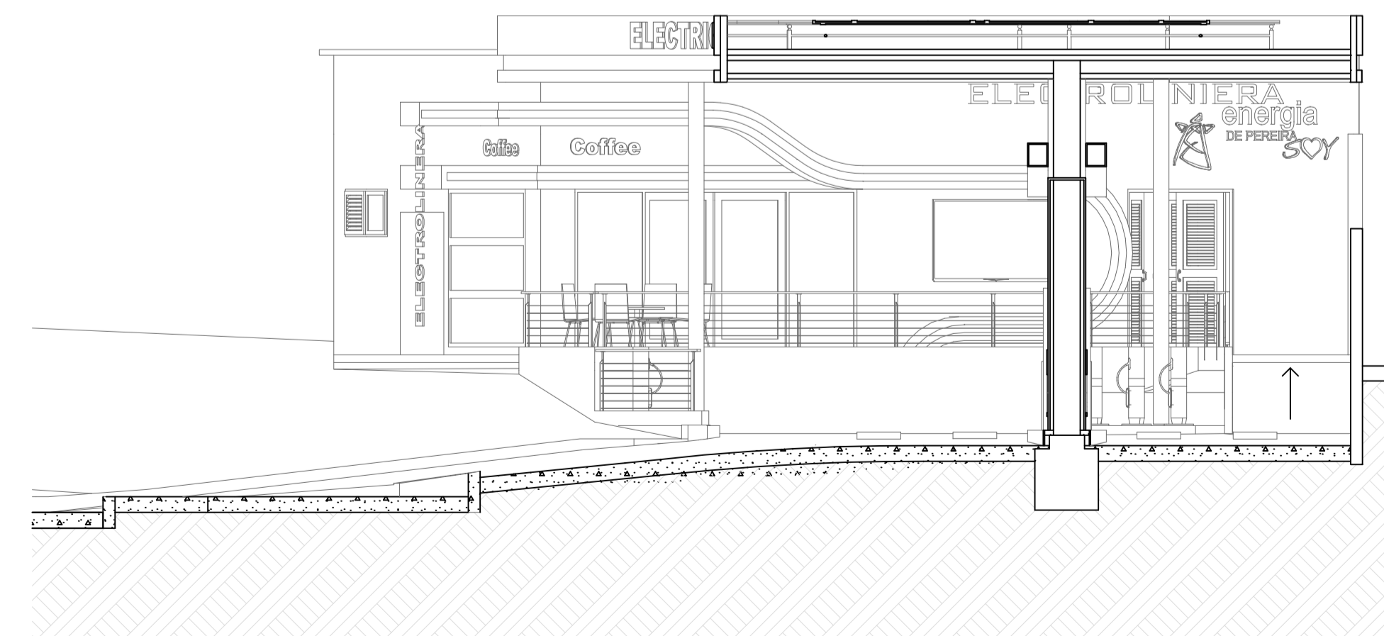
CORTE S - 06

PROYECTO ELECTROLINERA Puente Calle 13 Con Av. del Ferrocarril PEREIRA - RISARALDA